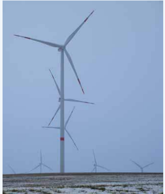
Windpark Kirchengel III, Thüringen