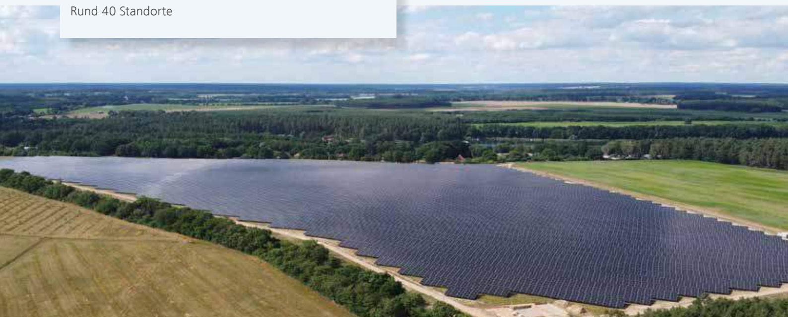
Solarpark Siena, Strasen, Mecklenburg-Vorpommern