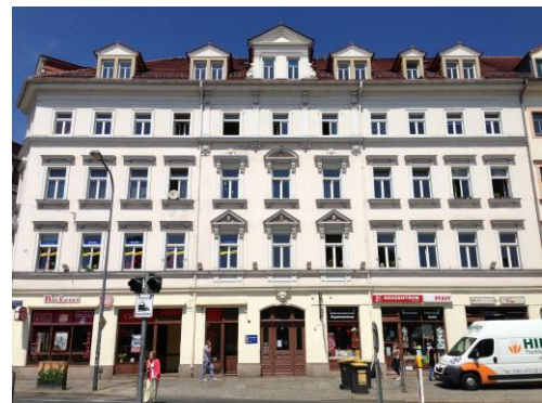
Dresden, Bautzner Straße

Hinweis: Der Durchschnittsertrag p.a. wurde auf Basis des Kommanditkapitals zzgl. Ausgabeaufschlag berechnet. Zur Ermittlung der Kapitalbindung wurde ein durchschnittlicher Beitrittszeitpunkt unterstellt. Die Beendigung wurde mit Rückzahlung des Kommanditkapitals zzgl. Ausgabeaufschlag angenommen. Der dargestellte lineare Durchschnittsertrag kann aufgrund unterschiedlicher Beitritte, Eintrittszeitpunkte etc. nicht auf jede individuelle Beteiligung übertragen werden.