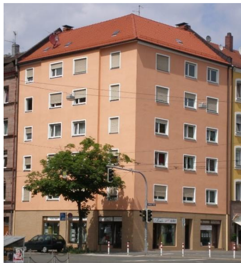
Nürnberg, Lothringer Straße

Hinweis: Der Durchschnittsertrag p.a. wurde auf Basis des Kommanditkapitals zzgl. Ausgabeaufschlag berechnet. Zur Ermittlung der Kapitalbindung wurde ein durchschnittlicher Beitrittszeitpunkt unterstellt. Die Beendigung wurde mit Rückzahlung des Kommanditkapitals zzgl. Ausgabeaufschlag angenommen. Der dargestellte lineare Durchschnittsertrag kann aufgrund unterschiedlicher Beitritte, Eintrittszeitpunkte etc. nicht auf jede individuelle Beteiligung übertragen werden.